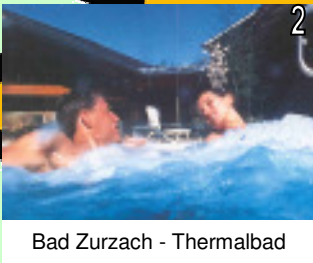
Bad Zurzach - Thermalbad