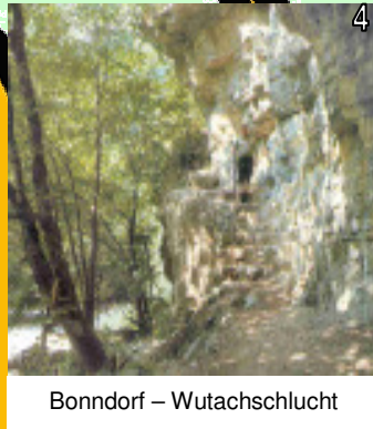
Bonndorf – Wutachschlucht