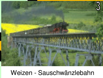
Weizen - Sauschwänzlebahn