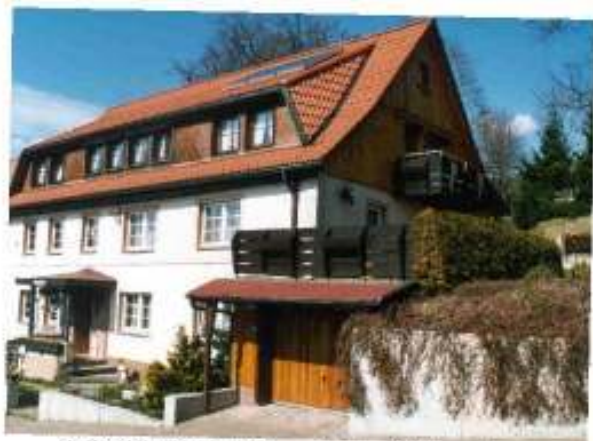
das Gästehaus mit herrlicher Südhanglage