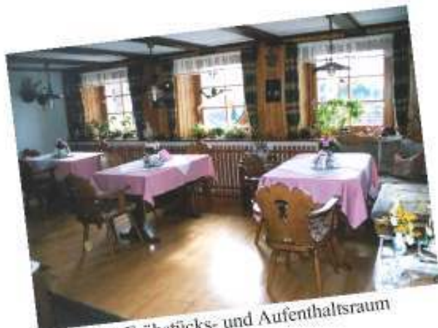
der Frühstücks- und Aufenthaltsraum